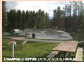
KRAANWATERAPPUNTEN IN OPENBARE PARKEN

ER IS TEVENS EEN PORSELEINEN WATERKARAF VOOR OP KANTOOR, HORECA EN THUIS GEBRUIK.