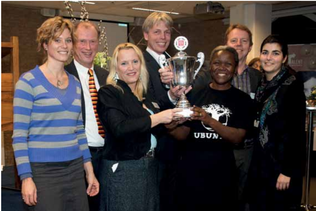
Goes neemt de bokaal voor "meest inspirerende Millennium Gemeente 2009" in ontvangst