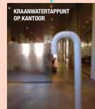
KRAANWATERAPPUNT OP KANTOOR

BOVENDIEN BLIJVEN DOOR HET DRINKEN VAN KRAANWATER, DE MILIEUBELASTENDE FACTOREN DIE GEPAARD GAAN MET HET DRINKEN VAN VOORVERPAKT FABRIEKSWATER (ZOALS CO2 UITSTOOT EN DE PRODUCTIE VAN GLAS EN PLASTIC) UIT.