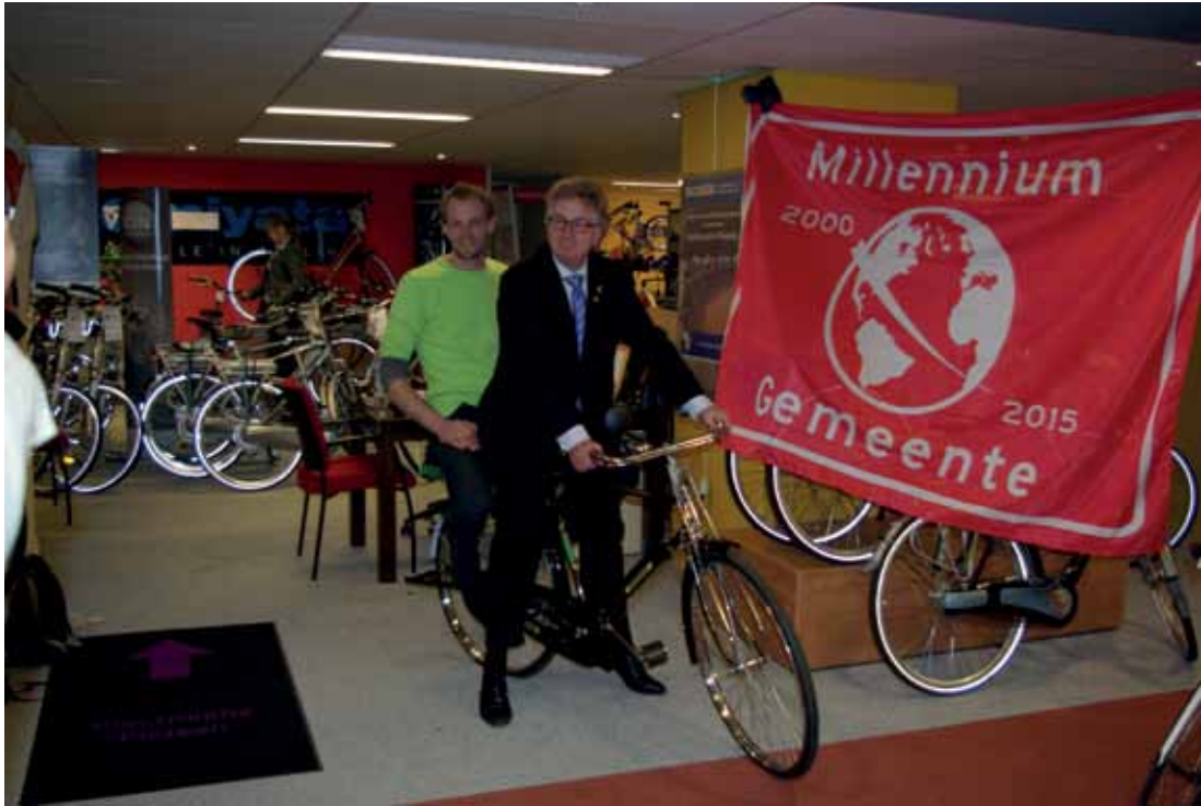
Lokale ondernemer Peerenboom en Millennium Gemeente Wageningen ondersteunen fietsproject Cycling Out Of Poverty in Oeganda.